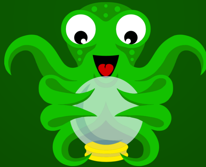
Image credits: @@linussandvide, @volkanolmez, @goian, @heftiba, @jeshoots, @miteneva, @hautier, @seteph, @rayhennessy, @dre0316, @kellysikema & @anniespratt on Unsplash. Huge Thanks for sharing!